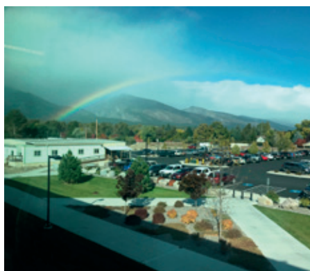
Lab with a view: Beautiful surroundings of the RML.

During my stay I had the chance to learn how to handle tick-borne encephalitis virus (TBEV), and we carried out preliminary experiments to investigate how MAVS, an adaptor molecule for the RIG-I like receptors, regulates the immune response within the central nervous system of TBEV infected mice. Besides working in the lab, I could also do some sight-seeing and visit some of the rural areas around Hamilton such as Lake Como with its stunning waterfall, the Painted Rocks state parks and Bear Creek. The colleagues from the Best lab took extremely good care of me, and between hikes and science they made my time at the RML an unforgettable experience. ”